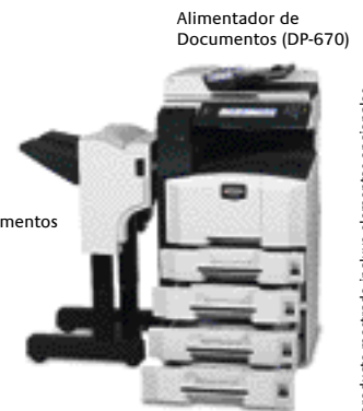
Alimentador de Documentos (DP-670)

Seleccione sus opciones para satisfacer sus necesidades: