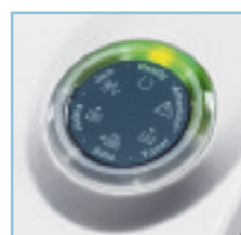
LED panel de control para un sencillo manejo

Una resolución de 1.200 ppp garantiza textos claros y gráficos nítidos