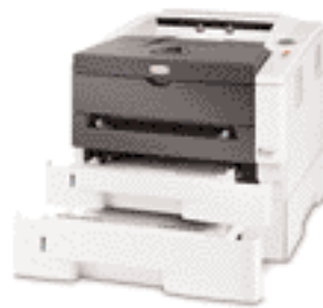
PF-100 Depósito de papel

El producto mostrado incluye elementos opcionales